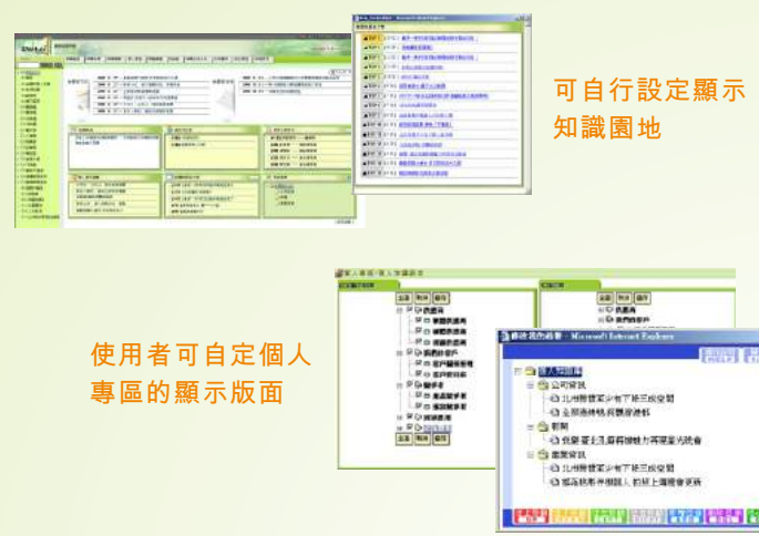
可自行設定顯示知識園地

提供使用者個人化知識設定，包含個人知識統計、我的最愛文章、最近瀏覽文章紀錄，並可自行設定顯示版面及訂閱所需的知識文件。