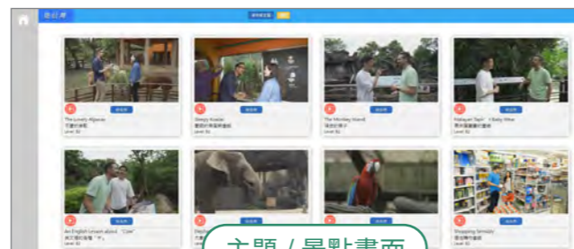
主題 / 景點畫面