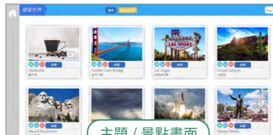
主題 / 景點畫面