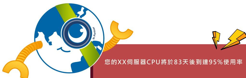
圖例1：N-Robot提前告警「您的XX伺服器CPU將於83天後到達95%使用率」

趨勢預測(Prediction)是藉由演算法則將收集到的歷史數據建立未來走勢模型。N-Partner公司現階段推出的 未來走勢預測功能分成短期趨勢(Short-term Prediction)以及長期趨勢(Long-term Prediction) ，皆已內建在最新版本的N-Reporter與N-Cloud產品裡，在保固期內的產品皆可透過韌體更新方式取得。在短期趨勢裡使用者可以看見未來數小時到數天裡的走勢圖形；而長期趨勢則呈現出長達數月後的線形可視圖。搭配預先定義的合理閾值，N-Reporter與N-Cloud智慧維運系統將提前告警資源不足狀況。