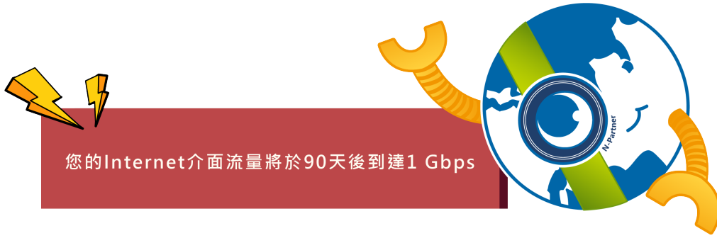
圖例2：N-Robot提前告警「您的Internet介面流量將於90天後到達1 Gbps」