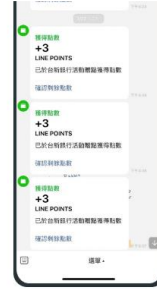
可結合Line錢包管理，透過LINE POINT實現各種用戶服務或獎勵活動