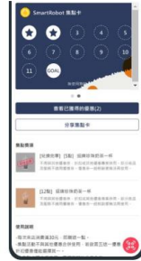
集點卡活動，可掃QR code進行多樣化互動或設定額外獎勵