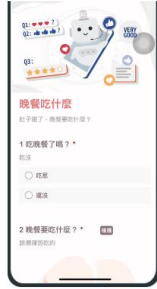
活動問卷，可結合FB或Line進行問卷調查並分享與好友