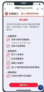
可開啟個人化服務，使用者可依個人喜好訂閱專屬相關服務通知