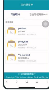
個人化錢包管理，可讓使用者自行管理電子活動序號、優惠券等