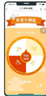
結合客戶忠誠度計畫，提供多樣化的遊戲活動，例如：樂透抽獎、幸運輪盤、有獎徵答等等