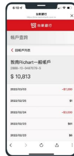
可提供個人化查詢服務，例如信用卡消費紀錄、保單繳費紀錄、貸款餘額、理賠申請進度等等