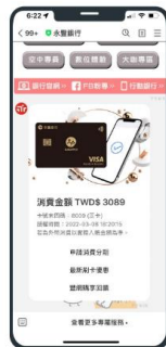
依照個人化消費情境提供優惠訊息，增加客戶黏著度