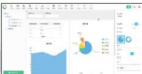
能提供各類複雜的數據分析