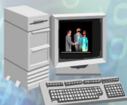
網路教材 點播伺服器