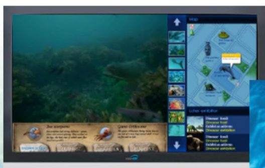
各學生教室的終端廣播