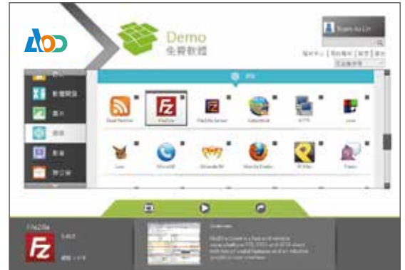
圖1. AOD 軟體服務隨選雲提供輕鬆易上手的介面