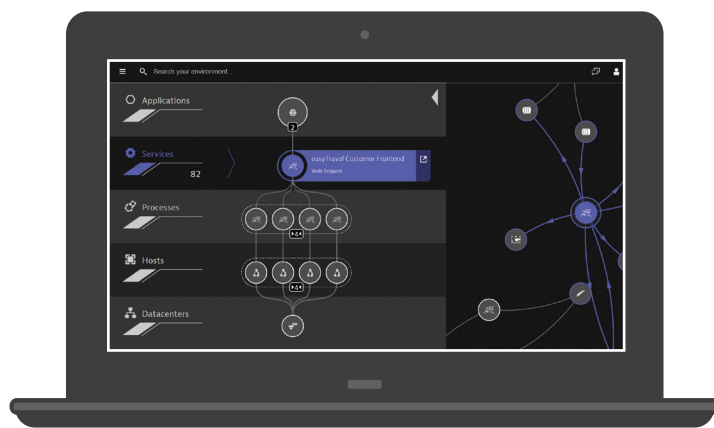
使用 Dynatrace 的 Smartscape 功能進行全端式透視解析

Dynatrace 具備一體化應用監控能力, 且無需進行配置。只需在主機上安裝OneAgent, Dynatrace 就可以藉此掌握應用程式的狀況。一旦發生故障, 人工智慧技術可讓您準確地得知故障發生的位置、發生的原因。