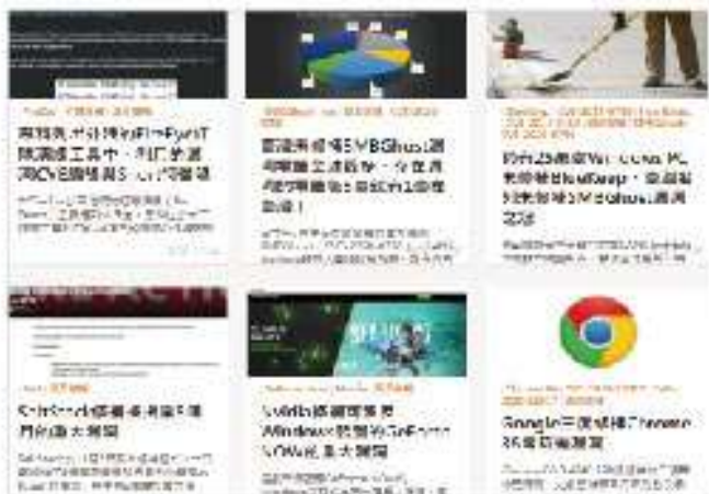
漏洞修補可以阻擋85%以上的攻擊

榮獲Gartner Peer Insights肯定, 提供識別、分類和管理漏洞功能。支援windows與其他3000多種常用軟體, 可提供背景更新。要被授予Gartner Peer Insights客戶首選獎, 供應商必須在市場中的Top 7排名。